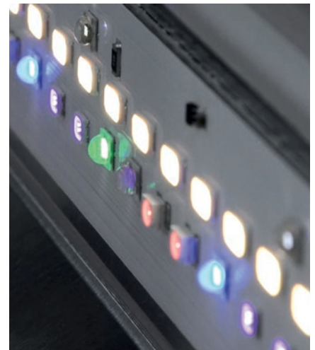
Die LED-Technik übernimmt bei der Farbabmusterung zukünftig die entscheidende Rolle.

Wer auf die »DLS«-Produkte von Just Normlicht umsteigen möchte, muss nicht zwingend seine vorhandene Farbprüfstation durch eine neue ersetzen. Hier bietet das Unternehmen die Möglichkeit, die alten Leuchten in der bestehenden Station durch »DLS«-Upgrade-Leuchten auszutauschen. Dies spart nicht nur Ressourcen, sondern auch Kosten, denn die Upgrade-Systeme sind in der Anschaffung viel günstiger als eine komplett neue Station mit LED-Technologie. Anwender, die eine