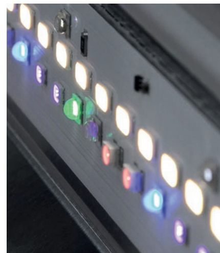
Die LED-Technik übernimmt bei der Farbabmusterung zukünftig die entscheidende Rolle.

Wer auf die »DLS«-Produkte von Just Normlicht umsteigen möchte, muss nicht zwingend seine vorhandene Farbprüfstation durch eine neue ersetzen. Hier bietet das Unternehmen die Möglichkeit, die alten Leuchten in der bestehenden Station durch »DLS«-Upgrade-Leuchten auszutauschen. Dies spart nicht nur Ressourcen, sondern auch Kosten, denn die Upgrade-Systeme sind in der Anschaffung viel günstiger als eine komplett neue Station mit LED-Technologie. Anwender, die eine