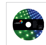
adJUST DLScontrol professional Software zur freien Lichtartenauswahl