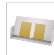
Probenhalter mit 5 Winkleinstellungen -15°, 0°, 15°, 45°, 60°