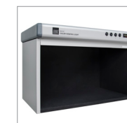
matt-schwarze Innenverkleidung für geringeren Kontrast bei dunklen Produkten