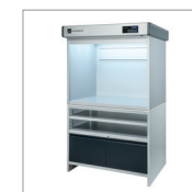
Unterschrank mit Schubladen