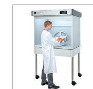
Untergestell auf Rollen